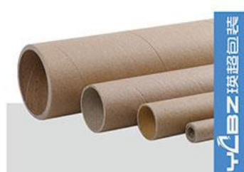
纸管： 厚度1-25MM 内径12-505MM