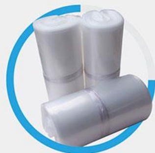
PE透明食品化工防潮袋