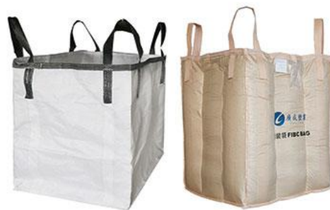
集装袋：支持各种规格定做